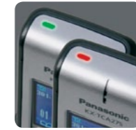
Indication des messages et appels entrants

Les bornes peuvent être numériques ou IP. Elles permettent de concilier mobilité et multi-sites grâce au hand-over automatique (maintien de la communication en cas de passage d'une cellule à l'autre).