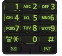
Numérotation facile, dans l'obscurité