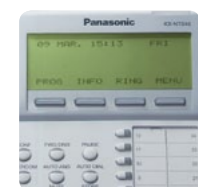
Écran LCD rétroéclairé