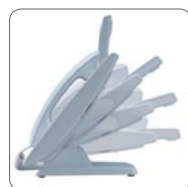
Plusieurs angles d'inclinaison

Module Bluetooth 1) Voyant de message/sonnerie