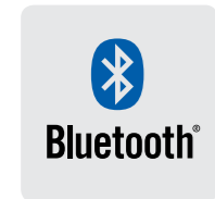
Oreillette Bluetooth en option