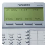
Écran LCD rétroéclairé