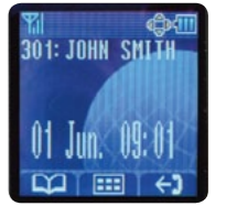
Écran LCD couleur facile à lire