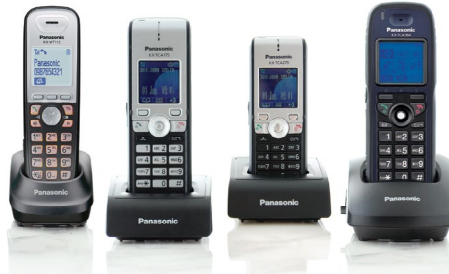
KX-WT115 Modèle d'entrée de gamme KX-TCA175 Modèle standard KX-TCA275 Modèle compact KX-TCA364 Modèle ultra-résistant