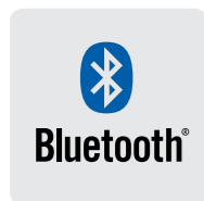
Module Bluetooth en option